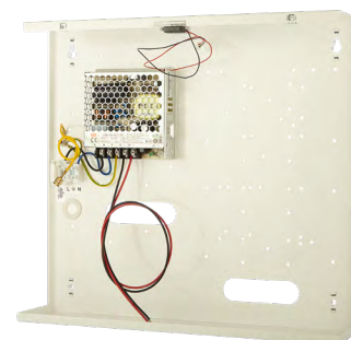
WS4-PS5 Caja de aluminio universal, montaje de pared, con una alimentación de 5A