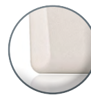
MTPADPS-RS-EH Gris claro - ABS