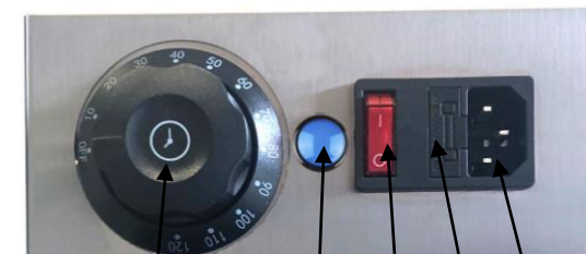
Temporizador PCO ON/OFF FUS 220V