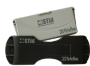
TeleTag® Tags parabrasis