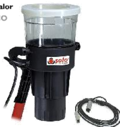
Solo 423 (110v) Solo 424 (230v)