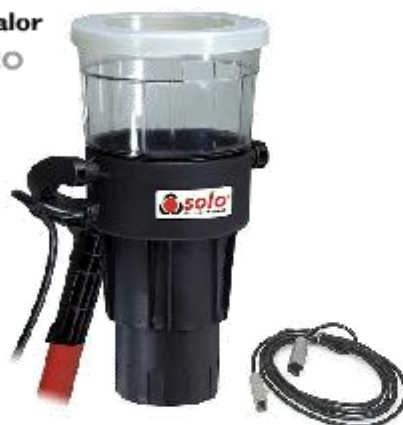
Solo 423 (110v) Solo 424 (230v)