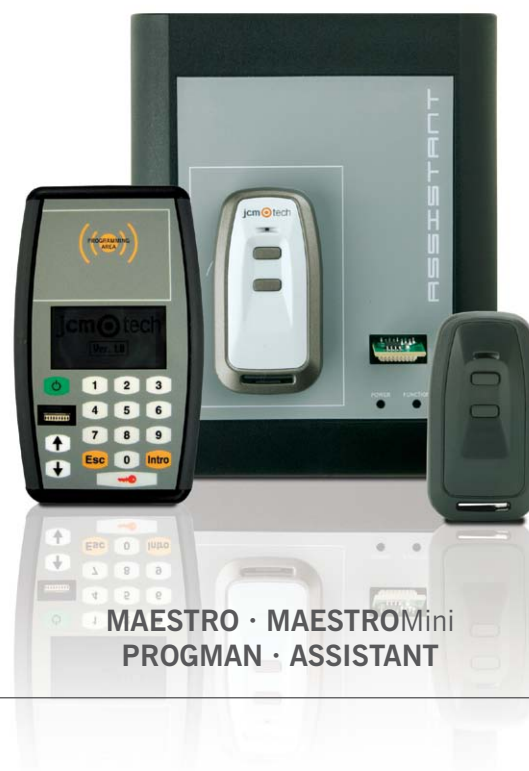
MAESTRO · MAESTRO Mini PROGMAN · ASSISTANT

Gestione y personalice sus emisores con las herramientas de programación 868 MHz.