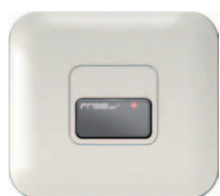
DISPARADOR DEL TAG